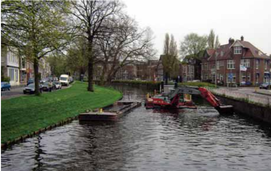
Baggerwerkzaamheden in Haarlem.

In tabel 2 zijn enkele mogelijke bronmaatregelen weergegeven, samen met een geschat percentage van baggervracht-reductie en de kosten. De resultaten van enkele ingevulde stadswatersystemen zijn samengevat in tabel 3. De handreiking toont voor deze systemen als voornaamste bronnen van baggerslibaanwas 'aanvoer bovenstrooms' (85%), 'riooloverstorten en regenwaterriolen' (27%), 'bladval' (20%), 'atmosferische depositie' en 'veenafbraak' (24%). De mate waarin een bepaalde bron bijdraagt, is wisselend en afhankelijk van specifieke kenmerken van het beschouwde watersysteem.