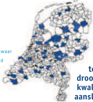
Figuur 1: Locaties waar gemeten is aan afstromend regenwater in Nederland.

De laatste jaren groeit het besef dat het afkoppelen van regenwater ongewenste emissies naar bodem, grondwater en oppervlaktewater kan veroorzaken. Uit metingen naar regenwaterkwaliteit blijkt dat de concentraties van stoffen zoals nutriënten en E.coli bacteriën hoog kunnen zijn. Eén van de oorzaken van hoge nutriëntgehalten uit regenwaterriolen is de aanwezigheid van foutieve aansluitingen van droogweerafvoer op het regenwaterriool. Dit artikel gaat in op de kwaliteit van regenwater en opsporingsmethoden van foutieve aansluitingen met diverse sensoren.